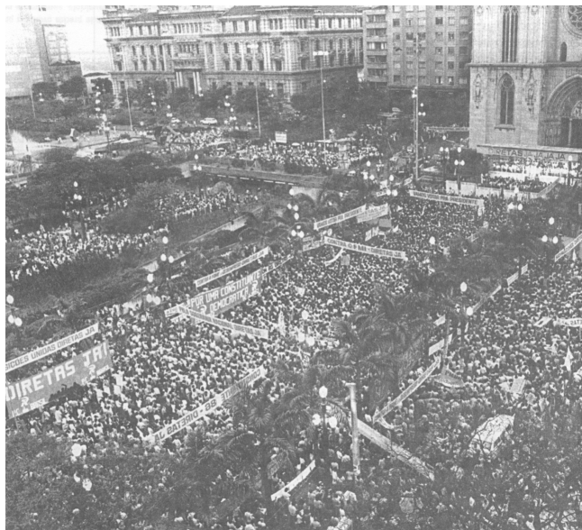
(Comício pelas Diretas Já, em São Paulo, 1984)

Para que existam hoje os direitos políticos, o direito de votar e ser votado, de escolher seus governantes e representantes, a sociedade lutou muito.